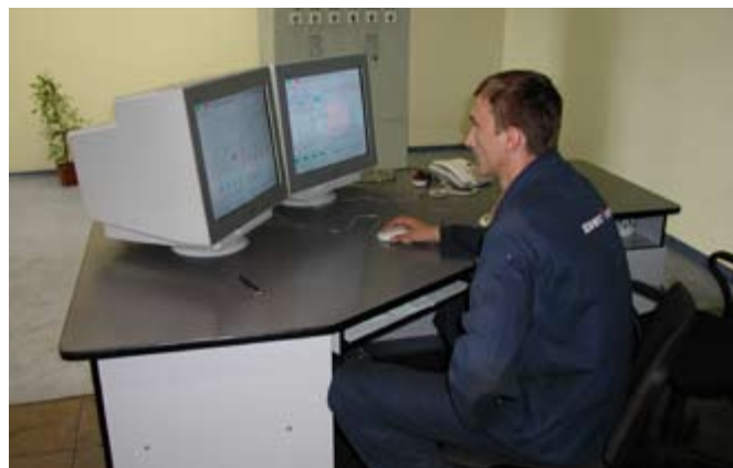
Автоматизированное рабочее место оператора котлоагрегата на базе InTouch

АРМ оператора-технолога предназначено для визуализации параметров ТП, дистанционного управления исполнительными устройствами, ввода заданий регуляторам, просмотра отдельных протоколов, отчетов и сводок, включения или отключения управляющих подсистем (авторегулирования, автоматического включения резерва, функционально-группового управления и др.) В качестве графического интерфейса использован программный пакет InTouch компании Wonderware. АРМ инженера предназначено для обслуживания ПТК. На нем выполняются такие задачи, как проведение диагностики технических средств ПТК, архивирование данных на долговременных носителях, формирование и просмотр отчетов и сводок, модификация параметров алгоритмов в контроллерах и другие. На АРМ инженера системы также установлен программный пакет проектирования, позволяющий инженерному персоналу (при наличии соответствующего доступа) модифицировать программное обеспечение АСУ ТП верхнего и нижнего